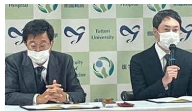
鳥取大学医学部附属病院原田病院長（左）と、佐々木病院長